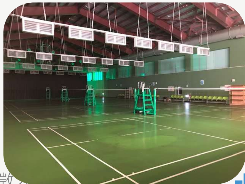
羽球場 排球場 籃球場